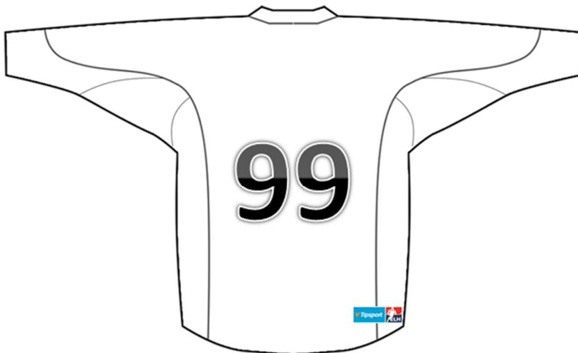
Náhled umístění loga Tipsport ELH na zadní straně dresu

5.9. Kluby jsou pro účely utkání Tipsport ELH povinny umístit na pravou spodní část zadní strany dresu logo Tipsport ELH o velikosti 10x3,5 cm.